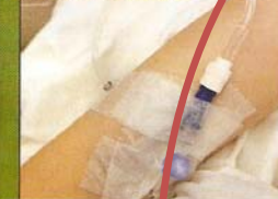
2010年是中環的一年，相信12月的李嘉欣亦曾帶着小小肚仔，在聖誕節那天，坐在中環門口，與親友家人慶祝聖誕。但當時她正處於孕中，所以當時她與家人慶祝聖誕時，身體健康與否，她們已經預知了！