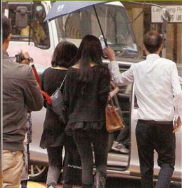
▲由於平治房車要入廠修理，嘉欣shopping完後，便改坐白色豐田七人車離開，當時換了另一位司機，服侍兩位闊大上車之餘，更不忘為她們打傘遮雨。

尤其適合孕婦感到胎兒蠕動比平日少，即可用心跳機檢查胎兒心跳是否正常，這樣不但可減低孕婦不必要的焦慮，更可及早發覺胎兒有沒有缺氧。