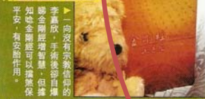
▲一向沒有宗教信仰的李嘉欣，手術後卻自覺知金剛經可以讓她保持平安，有安胎作用。