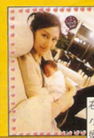
在為小王子載歌載舞 M囑說謝謝伐（不）要跳了，小囑快出來加入你的歌聲表演啦 重点是 你媽不會撻生（一一）

讓師傳表示：「孕婦最好係唔好抱其他的BB，因為肚內的胎兒會小器。」另外，古老習俗亦話由於BB的靈魂未生定，初生嬰兒不應讓其他大肚婆抱，因為BB的靈魂有機會落咗去人地個肚度，咁BB嘅病痛就會好多。李嘉欣親姨媽仔如子，經常抱他，也犯了大忌。李嘉欣不但經常抱家姐的兒子「小王子」，而小王子非常好動，不時手舞腳揮，難怪抱住他的嘉欣也叫他不要跳，怕踢到個胎早產。