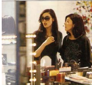
●嘉欣在位於M.A.C. Beauty 中心選購了多款護膚品及眼線，共花了近2小時。

●●佢住許家金巨羅的李嘉欣，自從懷孕以來，不時高調風騷談B，又扮到靚靚出席活動。不過踏入12月後，李嘉欣突然修心養性，不再出席公開場合，自閉在家安胎。