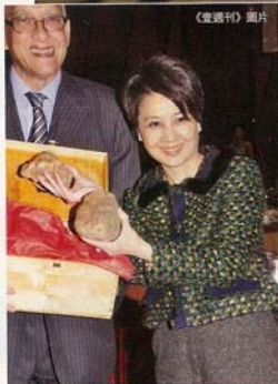
四太一向識探賭王，早前更以257萬投得白松露王送給賭王做生日禮物。

兩周前，賭王秘密入養和換便服，和做身體檢查，而是次入院全程由四太負責，貼身侍候賭王。上週日（16日），本刊獨家拍得四大探完賭王離開的照片。記者追問四太賭王入院一事，她只笑而不答。