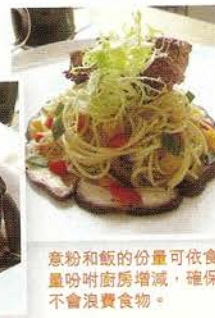
意粉和飯的份量可依食量份廚房增減，確保不會浪費食物。