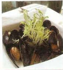
藍貝新鮮天然，在口腔散發出淡淡海洋味道。