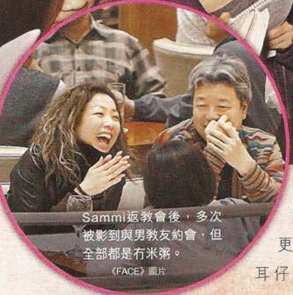
Sammi返教會後，多次被影到與男教友約會，但全部都是冇米粥。