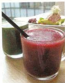
以有機紅菜頭打成的果汁味道清新，以後紅菜頭又多一種食法！

嘩，誰說健康瘦身餐一定無味道？別再給自己藉口，只要識得「揀飲擇食」，運用天然醬汁，有機宇宙飲食絕對無難度！